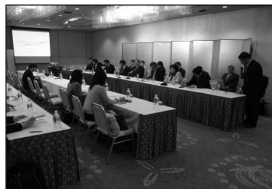
記者発表会（1月17日） テレビ局、新聞社など14社に出席いただきました。